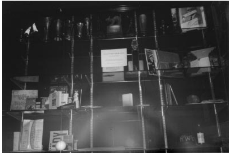
Lisää tavaraa vuosien saatosta esillä

Remontin kunnianhimoisena sivutulokseksena on tarkoitus vihdoinkin saada tehtyä "Polyteekkarimuseo - museopäivystäjän opas". Vihkonen, jossa olisi päivystysvuoroon saapuvalla nuoremmalle tieteen-