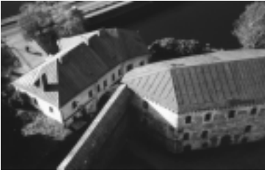
Viipurin linna tornistaan nähtynä.

päähänsä ja kikkailee venytetty kondominenän tasolle vedettynä. Yleisen remakan perusteella osaan mennä katsomaan tilannetta bussin