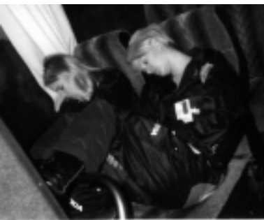
Toimittaja – vasemmalla – tokenee päivän rasituksista.

ihmisten päälle ja pois sirkuksesta, ja voitti itselleen siihenastisen xq-idiootin tittelin, joskin vain väliaikaisesti.