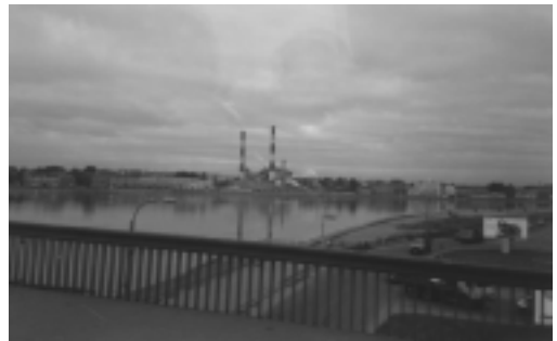
Pietari on kaunis kaupunki.

Tie huononee ja bussi hidastaa. Moottoritie aaltoilee allamme, molemmilla puolilla tietä näemme venäläisempää maisemaa, lähinnä suota. Ja hiekkahautoja. Pikkuhiljaa Pietari alkaa valua sivuillamme, saavumme kaupunkiin pysähtyen ensiksi Nesteen asemalla jatkonestetankkauksella.