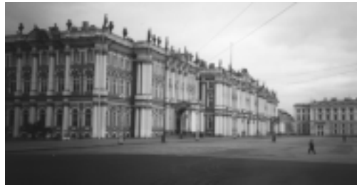
Eremitaasi edestä ja takaa, Eremitaasi istuu ja makaa.