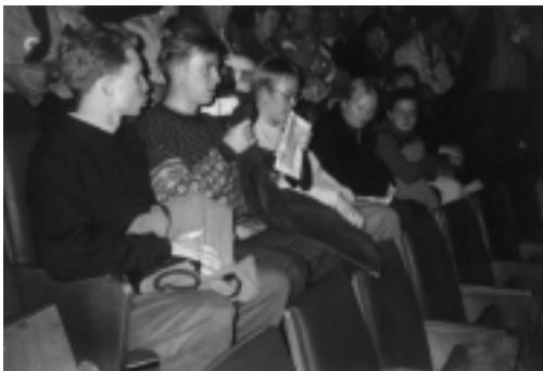
Matkaajat istuvat kiltisti aloillaan. Ainakin toistaiseksi.

Peräseinällä oli jotain outoja numeroita (55 ja 60), joista toinen kaikei oli sirkuksen ikä. Niinpä alussa arenalle astui vanhempi herrasmies, joka kertoili pitkiä pätkiä sirkuksen historiasta venäjäksi. Koska en kyseistä kieltä osaa, ehdin jo ihmetellä, onko kyseessä venäläinen stand-up komedia. Sen tosiseikka, että ihmiset eivät välillä nauraneet, vaan taputtivat, antoi aiheen epäillä, että jostain muusta on kysymys. Tosin yhtä hyvin se olisi voinut kertoa jotain vitsien tasosta.