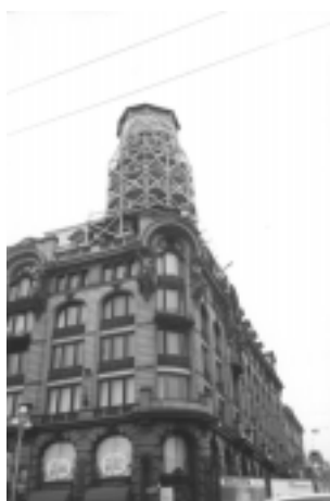
Saksalaistyylissä arkkitehtuuria remontin alla keskustassa.