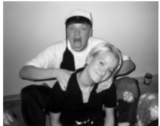
Seesteistä säätää hyteissä.

KFC:ssä törmäämme tuttuihin, mutta he siirtyvät nopeasti pois altamme. Saamme rahanarvoisen vihjeen