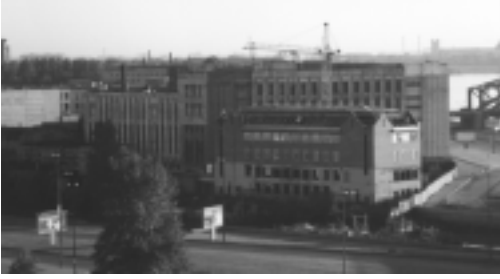
Näkymä hotellihuoneen ikkunasta. Industrialismi rules ok.

järkyttäviä summia, joten tyydyimme vaihtamaan rahaa ja menemään syömään. Ravinteli on perivenäläinen ja sen saa tuta sieltä sun täältä. Asiasta tarkemmin toisaalla. Ostoksille päätämme palata huomenissa paremmalla ajalla ja enemmänä valuutalla.