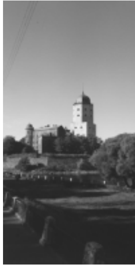
Linna myös normaalista perspektiivistä.

Moni matkalainen väittää saavansa ensimmäisen kerran matkan aikana kunnan ruokaa tai olutta, mutta itse olin havainnut molempien hyödykkeiden riittävän saannin myös rajan toiselta puolelta. Ehkä vika