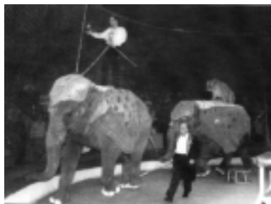
Eläinten kesytystä. Norsuja ja tiikereitä.

Tauon jälkeen esitys huipentui suureen eläinten kesyttäjä -numeroon, jossa oli sirkusten perusaineisto: tiikereitä ja norsuja. Kyseinen numero todellakin koostui neljästä tiikeristä ja kahdesta norsusta. Tiikerit hyppivät norsujen yli ja norsut puolestaan tiikerien.