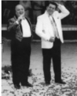
Sirkuksen esiintyviä taiteilijoita.

selvisi – tai ainakin asiat – ja muut pääsivät viimeistään tauolla sisään Tipun lähtiessä viemään Zumbaa hotelliin hävittyään KPS:n Towolle.