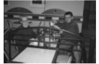
Helsingin lähin Kentucky Fried Chicken.

Lopulta päätämme jatkaa matkaamme pikaiselle aterialle ja nappaamme taksin ajaaksemme Nevski Prospektia pari kilometriä takaisin Kentucky Fried Chickeniin. Puhun taksikuskin kanssa sujuvasti venäjää, melkein koko sanavarastoni on käytössä, kun ohjaan meidät pikaruokalan eteen. Kuskia homma huvittaa ja hän rahastaa matkasta kymmenen ruplaa.