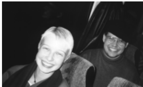
Toimituksella on hymy herkässä vielä Haminan jälkeen.

Aika nopeasti käy selville, että emme pysty täydentämään uuden kiltahuoneen seinää "Pietari 267" -kyltillä, koska sellainen ei satu silmiimme. Emme anna tämän kuitenkaan lannistaa tunnelmaa, vaan jatkamme matkaamme pimenevässä illassa kohti Helsinkiä ja Otaniemeä.