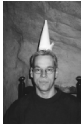
Päätoimittaja linnanheiton pyöreässä tornissa.