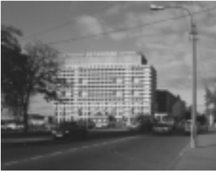
Hotelli Ohtinskaja, Bolsheohtinskij Prospekt 4