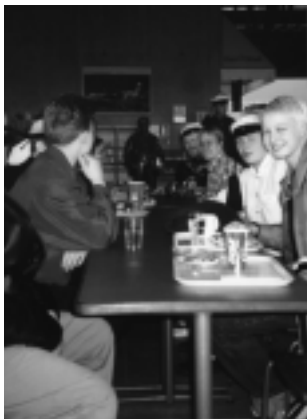
Kunniavieraanamme EuroStradan pitkän pöydän päässä VI.Lenin.