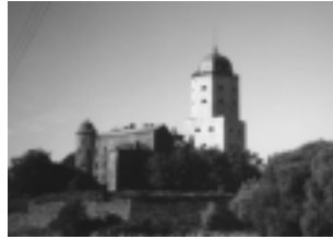
Viipurin linna syysauringon loisteessa.

Olemme siirtyneet Venäjän puolelle, kännykässä on vielä kenttää, tie on kunnossa ja maisemat näyttävät ihan suomalaisilta.