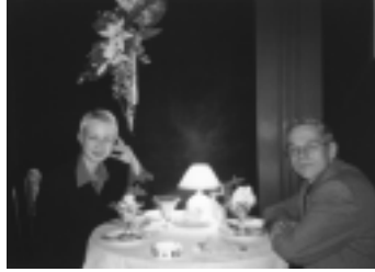
Toimituskunnan tutkimusretkikunta jälkiruokavaiheessa ravintola Kafe Piterissä.

Paluumatkalla sunnuntaina pysähdymme Viipurissa, jonka läpi vain pyyhälsimme pohjoistuulen lailla tulo-