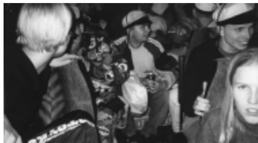
Linja-autossa on myös tunnelmaa...