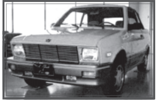
Uusmedian leivissä voit sinäkin päätyä Yugon kyytiin.

Tietotekniikka-alalla on edessään visainen pulma; sen kasvunäkymiä rajoittaa valtava työvoimapula, ja valmistuva työvoima mieltää itsensä korkeapalkkaiseksi netsetiksi (vrt. jetset). Ohjelmoija on IT-teollisuuden peruskiveä, jota tarvitaan massoittain. Toisaalta ammatti vaatii kohtuullisen koulutuksen ja runsaasti kärsivällisyyttä. Kyselyyn vastaneet olivat kuitenkin vaisuja palkkatarjouksissaan: Alle puolet vastasi kysymykseen palkasta tarjoten useimmiten 10000-12000 markkaa. Sekä palkka-