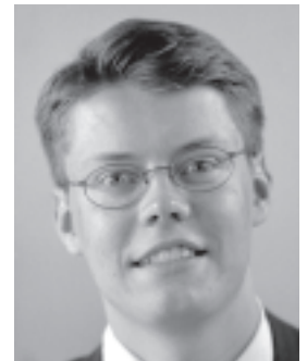
Hieronymus Puheenjohtaja & phuksiwaari senior

Kulta, milloinkas me on viimeksi myyty yhdessä wappulehteä...?