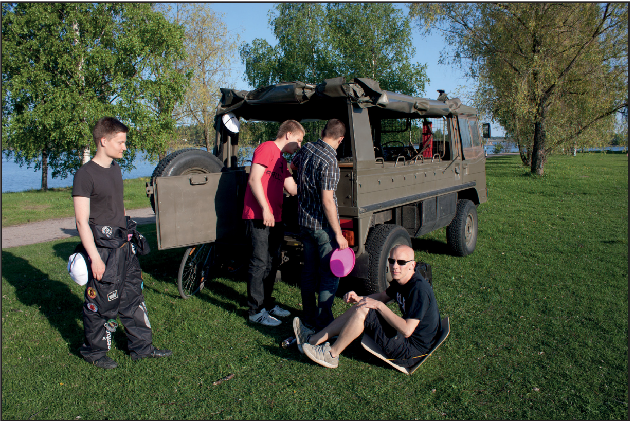
Kesällä Zip-code ei juuri irkkaamaan kerennyt, kun piti ajaa Pinzgauerilla.