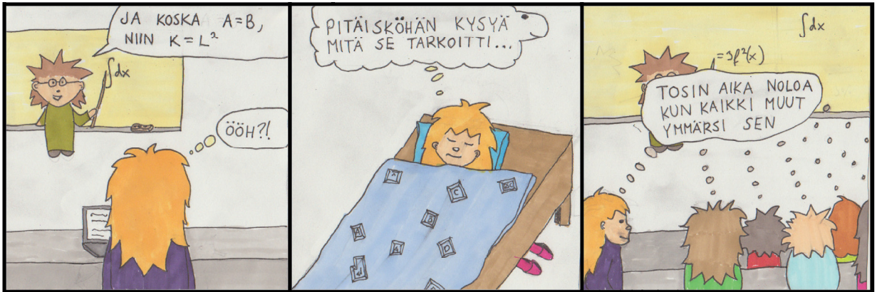
KUVITUS: KATI SAARIKANGAS